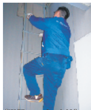
【避難ハシゴの点検】

消火器具に亀裂や破損が無い、消火器具内部の粉末が固まっていないか、耐用年数は過ぎていないか、一つ一つ点検します。 いざという時のためにも、消火器具の設置場所を今一度、確認しておきましょう!