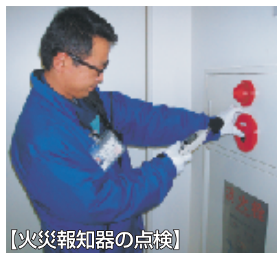
【火災報知器の点検】

火災報知器が正しく作動するかを点検し、警報音が入居者の皆さまの耳に届く音圧かどうかを専用の測定器を使用し、測ります。 避難経路確保のためや消防設備点検を円滑に進めるため、火災報知器の前や廊下(共用部分)に物を置かないようにしましょう!