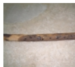
腐蝕した地下灯油埋設配管

灯油地下タンク、地下埋設配管の定期点検は、消防法で新設から15年までは3年ごと、15年を超える場合は1年ごとと定められています(ただし、15年を超えても一定の条件を満たしているものは3年)。