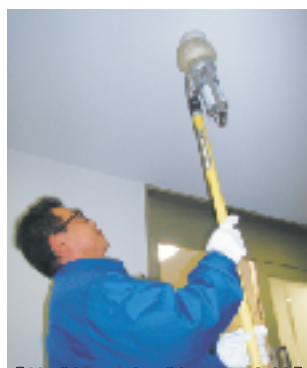
【熱感知器・煙感知器の点検】

火災報知器が正しく作動するかを点検し、警報音が入居者の皆さまの耳に届く音圧かどうかを専用の測定器を使用し、測ります。 避難経路確保のためや消防設備点検を円滑に進めるため、火災報知器の前や廊下(共用部分)に物を置かないようにしましょう!